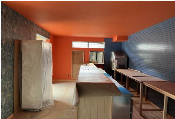
令和7年5月オープンに向け準備中

支援機関 えひめ産業振興財団（ビジネスサポートオフィス） 支援内容 移住者による起業